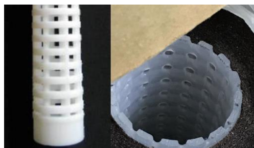
従来品、他社品コア