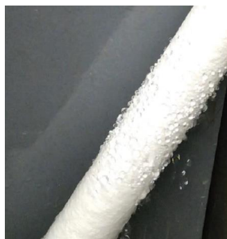
コア材通水実験画像